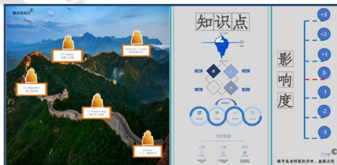
聚合领导力 五级进阶模拟图